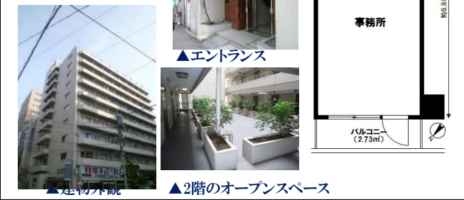
▲建物外観 ▲2階のオープンスペース

【物件概要】●所在:中央区新川2-2-1●権利:所有権 ●専有面積:20.40㎡●間取り:事務所仕様(北西向き) ●SRC造10階建2階部分●総戸数:144戸●竣工:S52.4 ●管理:日勤●管理費:6,520円/月●修繕積立金:4,000円/月 ●現況:賃貸中(月額賃料73,000円※税込) <売主>