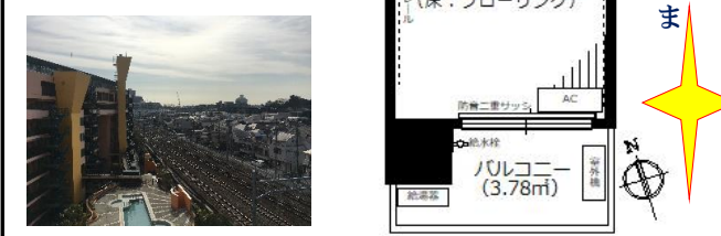
▲バルコニーからの眺望