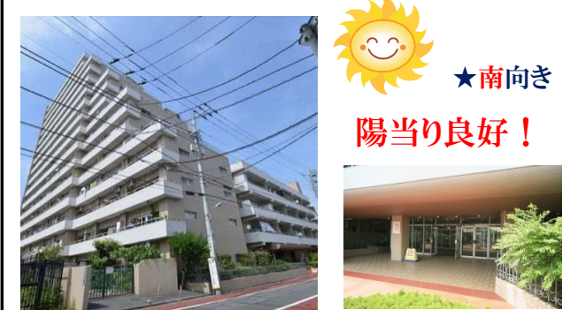
▲建物外観 ▲エントランス

【物件概要】●所在:品川区南大井5-11-13●権利:所有権 ●専有面積:22.95㎡●間取り:1K(南向き) ●SRC造 15階建7階部分●総戸数:260戸●竣工:S48.3 ●管理:住込●管理費:4,900円/月●修繕積立金:3,100円/月 ●現況:リフォーム工事中 <売主>