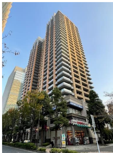
▲建物外観(白山通り側)

◎平成15年築、RC・SRC造地下3階付29階建 総戸数324戸の大規模タワーマンション